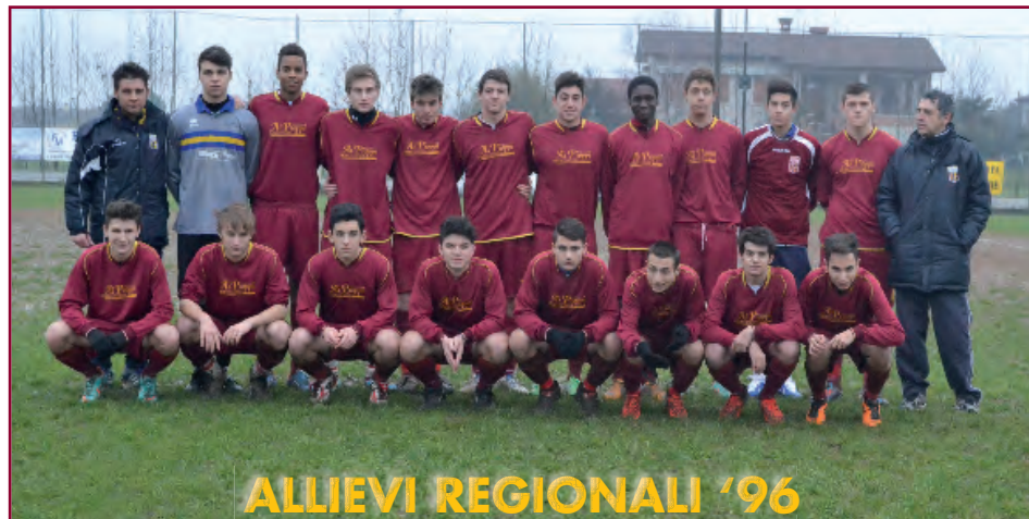
ALLIEVI REGIONALI '96

Allievi Reg. '96: Real Vicenza - Alba B. Roma Allievi Reg. Sp. '97: Alba B. Roma - L. Venezia Giovanissimi Reg. '98: Alba B. R. - Povegliano Giovanissimi Pr. '99: Povegliano - Alba B. Roma